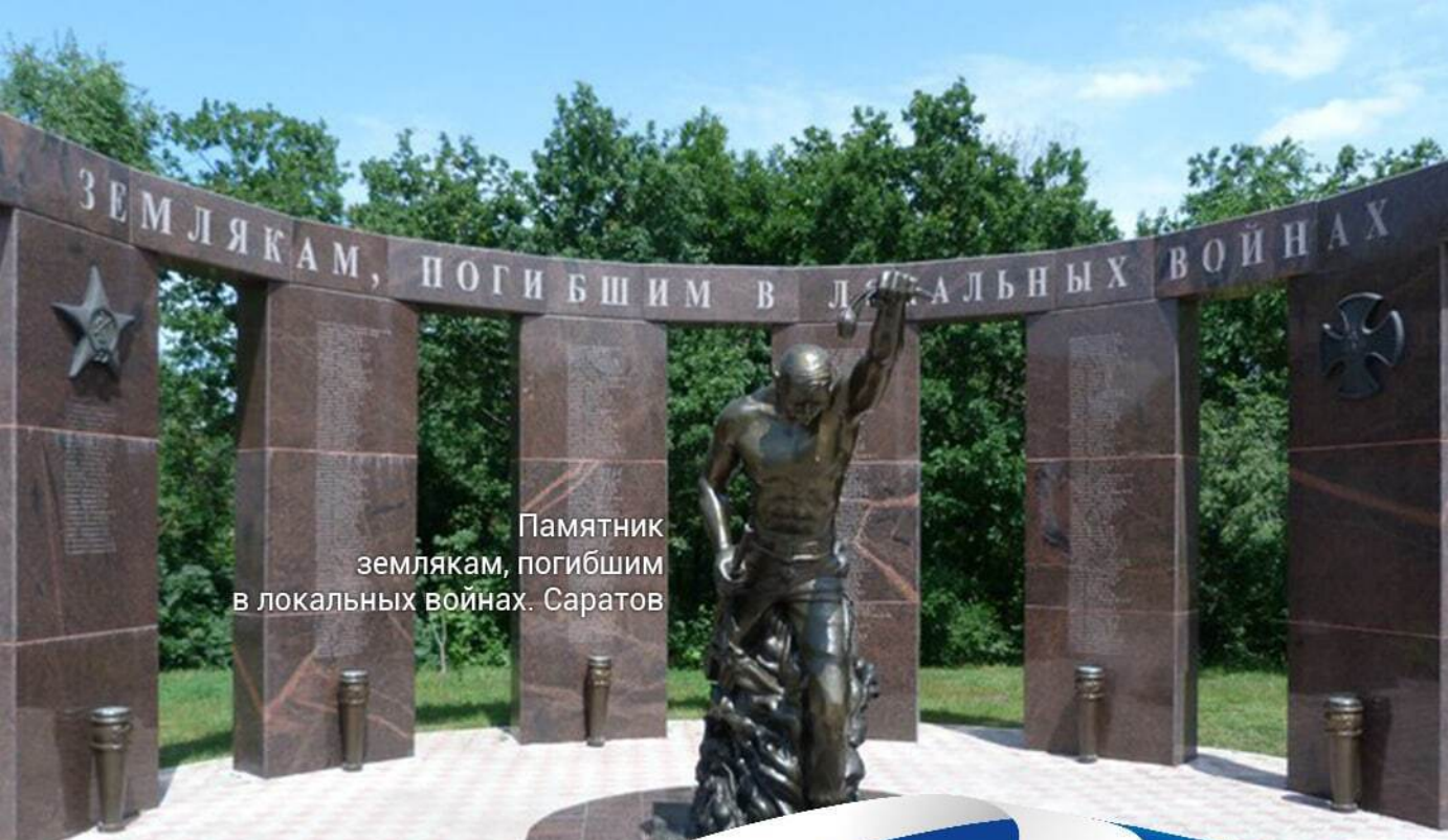
Памятник землякам, погибшим в локальных войнах. Саратов