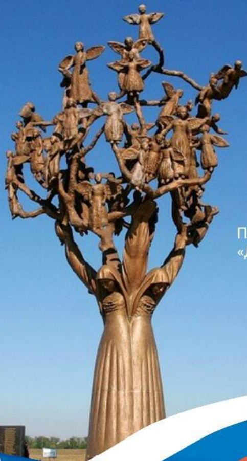
Памятник «Древо скорби» в Беслане