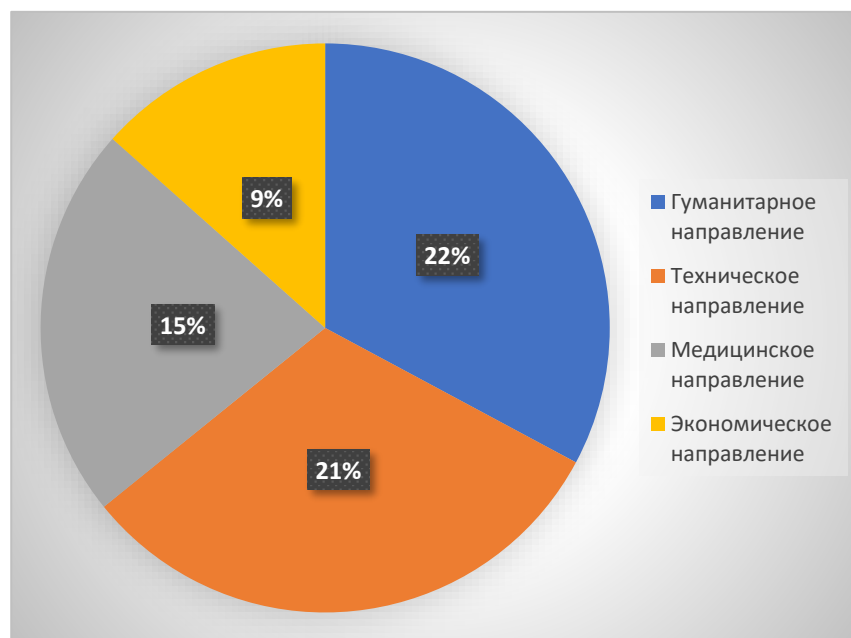
Рис.2 «Кем ты хочешь стать?»

Одиннадцатиклассники выбирают в большей степени гуманитарное направление, в частности: психология, педагогика, журналистика, филология и история. На втором месте-техническое направление, на третьем- медицинское направление, на четвертом-экономическое. Ученики 11-х классов более адекватно оценивают свои возможности, учитывая востребованные профессии на рынке труда в регионе.